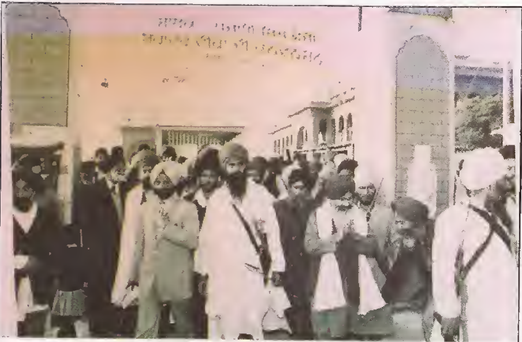
ਸੰਤ ਜਰਨੈਲ ਸਿੰਘ ਜੀ ਅਤੇ ਮੋਰਚਾ ਡਿਕਟੇਟਰ ਹਰਚੰਦ ਸਿੰਘ ਲੋਂਗੋਵਾਲ ਪੰਜਾਬ ਦੇ ਸਾਬਕਾ ਸਿੱਖ ਫੌਜੀਆਂ ਦੀ ਕਨਵੈਨਸ਼ਨ 'ਚ ਸਮੁਲੀਅਤ ਉਪਰੰਤ ਬਾਹਰ ਆਉਂਦੇ ਹੋਏ।