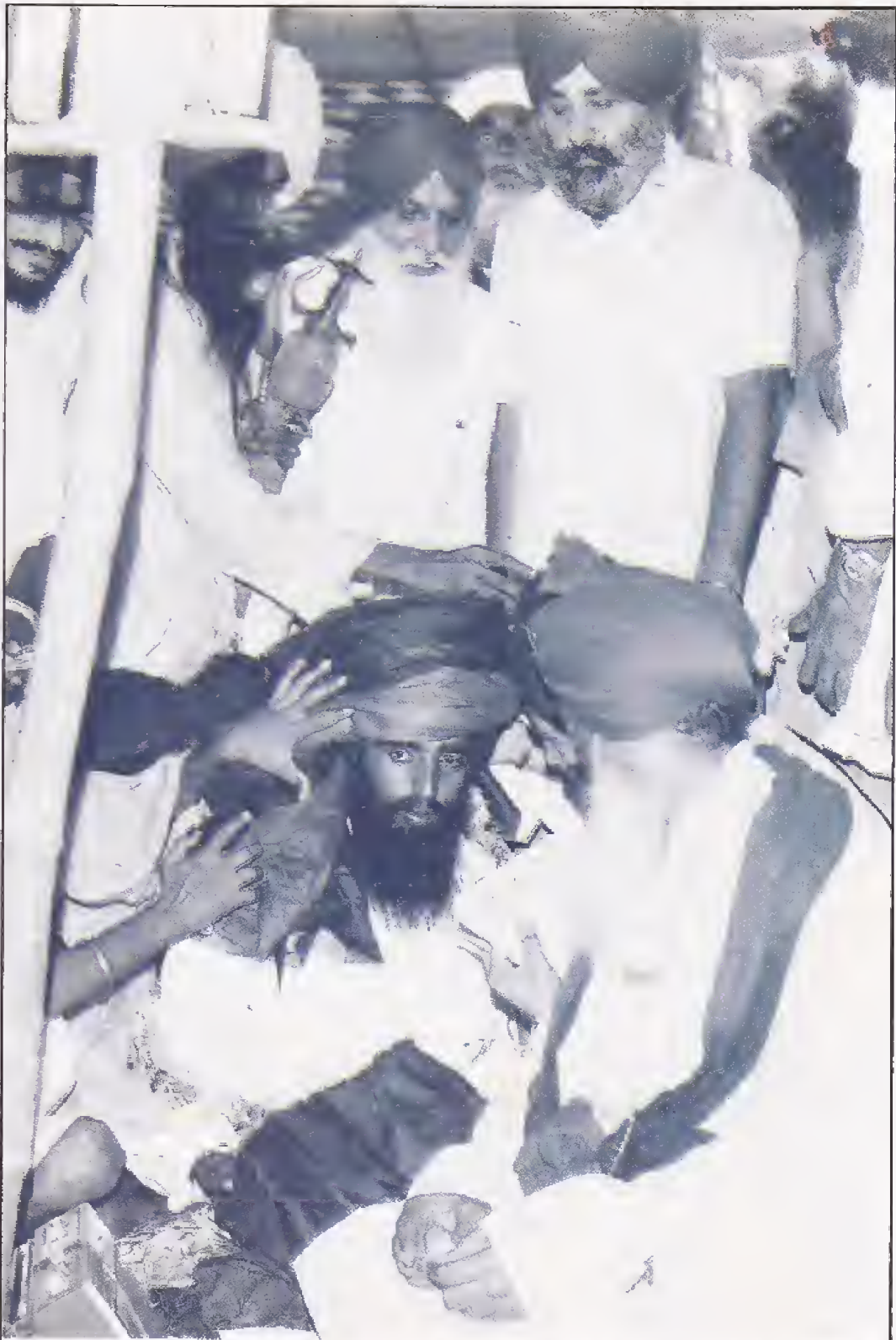
ਸੰਤ ਜਰਨੈਲ ਸਿੰਘ ਖ਼ਾਲਸਾ ਦੀ ਦਮਦਮੀ ਟਕਸਾਲ ਦੇ 14ਵੇਂ ਮੁਖੀ ਵਜੋਂ ਦਸਤਾਰਬੰਦੀ ਮੌਕੇ ਹਾਜ਼ਰ ਪੰਜਾਬ ਦੇ ਤਤਕਾਲੀ ਅਤੇ ਮੌਜੂਦਾ ਮੁੱਖ-ਮੰਤਰੀ ਪ੍ਰਕਾਸ਼ ਸਿੰਘ ਬਾਦਲ (ਜੋ ਸੰਤ ਜਰਨੈਲ ਸਿੰਘ ਦੀਆਂ ਗੌਰਵ -ਮਈ ਸੇਵਾਵਾਂ ਅਤੇ ਇਤਿਹਾਸਕ ਯੋਗਦਾਨ ਨੂੰ ਸਿੱਖ ਮਾਨਸਿਕਤਾ 'ਚੋਂ ਮਿਟਾਉਣ ਦੀਆਂ ਅਸਫਲ ਕੋਸ਼ਿਸ਼ਾਂ 'ਚ ਕਾਰਜਸ਼ੀਲ ਹੈ) ਅਤੇ ਜਥੇਦਾਰ ਗੁਰਚਰਨ ਸਿੰਘ ਟੌਹੜਾ।