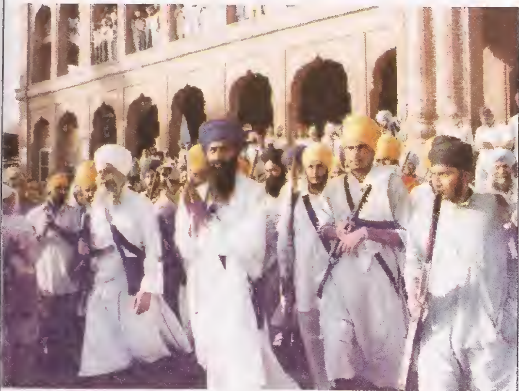
ਸੰਤ ਜਰਨੈਲ ਸਿੰਘ ਖ਼ਾਲਸਾ ਭਿੰਡਰਾਂਵਾਲੇ ਆਪਣੇ ਜੁਝਾਰੂ ਕਾਫਲੇ ਨਾਲ ਰੋਜ਼ਮੱਰਾ ਵਾਂਗ ਗੁਰੂ ਰਾਮ ਦਾਸ ਲੰਗਰ ਦੀ ਇਮਾਰਤ 'ਤੇ ਸਾਰਾ ਦਿਨ ਸਿੱਖ-ਸੰਗਤਾਂ ਨੂੰ ਮਿਲਣ ਉਪਰੰਤ ਸ਼ਾਮ ਦੇ ਸਮੇਂ ਸ੍ਰੀ ਅਕਾਲ ਤਖਤ ਸਾਹਿਬ ਦੇ ਨਾਲ ਜੁਝਵੀਂ ਆਪਣੀ ਰਿਹਾਇਸ਼ ਵੱਲ ਵਾਪਸ ਜਾਂਦੇ ਹੋਏ।