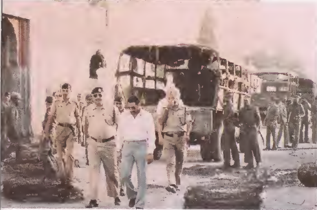
ਫੌਜੀ ਹਮਲੇ ਮਗਰੋਂ ਦਰਬਾਰ ਸਾਹਿਬ ਕੰਪਲੈਕਸ ਭਾਰਤੀ ਫੌਜ ਦੀਆਂ ਸੰਗੀਨਾਂ ਦੇ ਸਾਏ ਹੇਠ।