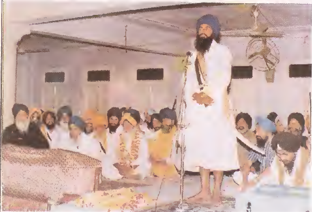
ਸੰਤ ਜਰਨੈਲ ਸਿੰਘ ਭਿੰਡਰਾਂਵਾਲੇ ਧਰਮ-ਯੁੱਧ ਮੋਰਚੇ 'ਚ ਗ੍ਰਿਫਤਾਰੀ ਦੇਣ ਜਾ ਰਹੇ ਵਲੰਟੀਅਰਾਂ ਨੂੰ ਦੀਵਾਨ ਹਾਲ ਮੰਜੀ ਸਾਹਿਬ ਦੀ ਸਟੇਜ ਤੋਂ ਸੰਬੋਧਨ ਕਰਦੇ ਹੋਏ।