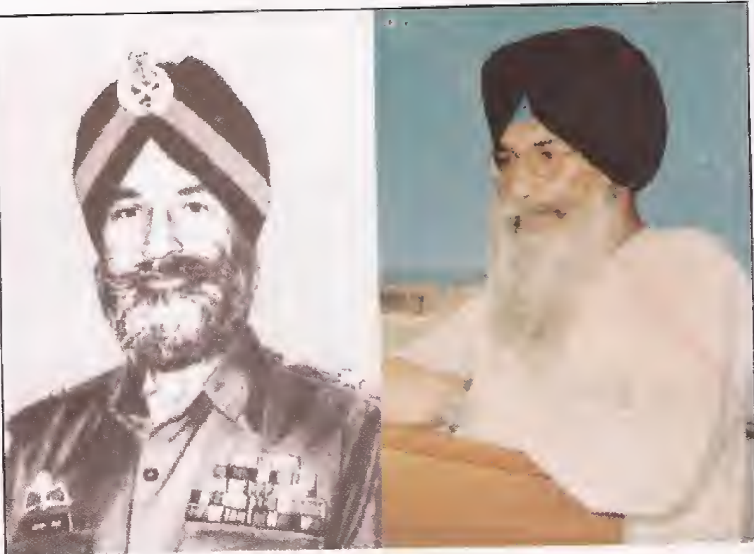
ਸ੍ਰੀ ਦਰਬਾਰ ਸਾਹਿਬ ਅਤੇ ਸ੍ਰੀ ਅਕਾਲ ਤਖ਼ਤ ਸਾਹਿਬ ਦੇ ਸਨਮੁਖ ਭਾਰਤੀ ਫੌਜ ਦਾ ਦ੍ਰਿੜਤਾ ਅਤੇ ਬਹਾਦਰੀ ਨਾਲ ਟਾਕਰਾ ਕਰਦਿਆਂ ਸ਼ਹੀਦੀ ਜਾਮ ਪੀਣ ਵਾਲੇ ਅਣਖੀ ਯੋਧੇ ਜਨਰਲ ਸ਼ਬੇਗ ਸਿੰਘ ਆਪਣੇ ਜੀਵਨ ਦੇ ਦੋ ਵੱਖ-ਵੱਖ ਰੂਪਾਂ ਵਿੱਚ।