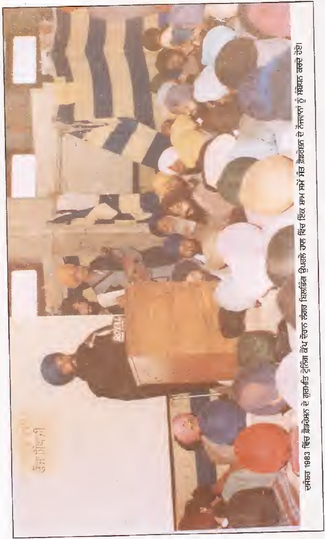
ਦਸੰਬਰ 1983 ਵਿੱਚ ਫੈਡਰੇਸ਼ਨ ਦੇ ਗੁਰਮਤਿ ਟ੍ਰੇਨਿੰਗ ਕੈਂਪ ਦੌਰਾਨ ਲੰਗਰ ਬਿਲਕਿੰਗ ਉਪਰਲੇ ਹਾਲ ਵਿੱਚ ਇੱਕ ਸ਼ਾਮ ਸਮੇਂ ਸੰਤ ਫੈਡਰੇਸ਼ਨ ਦੇ ਨੌਜਵਾਨਾਂ ਨੂੰ ਸੰਬੋਧਨ ਕਰਦੇ ਹੋਏ।