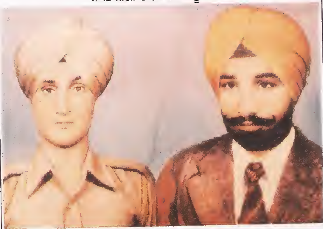
ਸ੍ਰੀ ਦਰਬਾਰ ਸਾਹਿਬ ਅਤੇ ਸ੍ਰੀ ਅਕਾਲ ਤਖ਼ਤ ਸਾਹਿਬ ਦੀ ਬੇਹੁਰਮਤੀ ਦਾ ਬਦਲਾ ਲੈਣ ਵਾਲੇ ਸੂਰਬੀਰ ਯੋਧੇ ਸ਼ਹੀਦ ਭਾਈ ਸਤਵੰਤ ਸਿੰਘ ਅਤੇ ਸ਼ਹੀਦ ਭਾਈ ਬੇਅੰਤ ਸਿੰਘ।