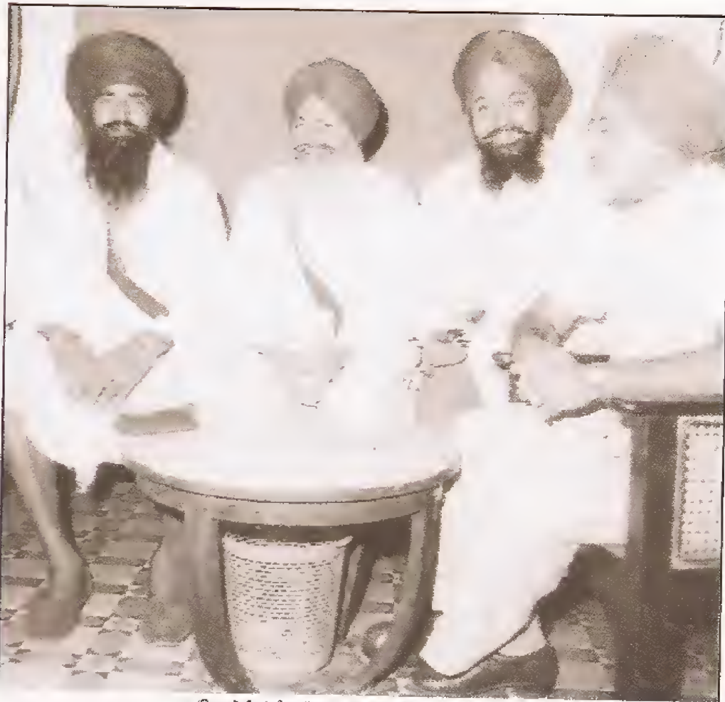
ਉਹ ਹਾਂਸੇ ਸਿਨ੍ਹਾਂ ਅੰਦਰ ਬੁੱਕਲ ਦੇ ਸੰਪਾਂ ਵਾਲਾ ਜਹਿਰ ਲੁਕਿਆ ਹੋਇਆ ਸੀ। ਸੰਤ ਜਰਨੈਲ ਸਿੰਘ ਸੇਰਚਾ ਡਿਕਟੇਟਰ ਹਰਚੰਦ ਸਿੰਘ ਲੌਂਗੋਵਾਲ, ਬਲਵੰਤ ਸਿੰਘ ਰਾਮੁਵਾਲੀਆ ਅਤੇ ਸਾਬਕਾ ਵਿੱਤ ਮੰਤਰੀ ਬਲਵੰਤ ਸਿੰਘ ਦੀ ਧੌਖੇਬਾਜ਼ ਜੁੱਡਲੀ ਨਾਲ।