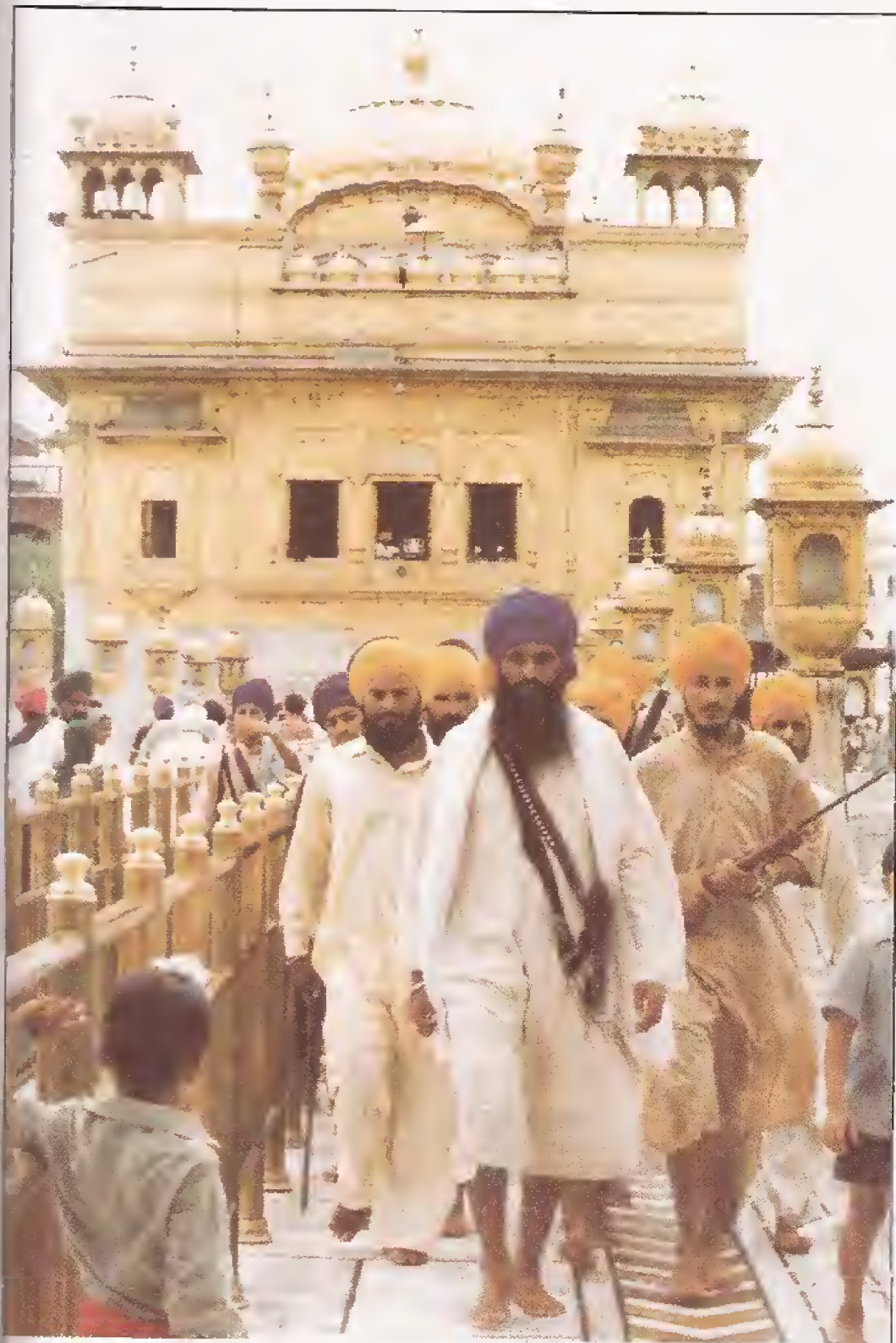
ਸੰਤ ਜਰਨੈਲ ਸਿੰਘ ਜੀ ਖਾਲਸਾ ਸ੍ਰੀ ਦਰਬਾਰ ਸਾਹਿਬ ਦੇ ਦਰਸ਼ਨ ਕਰਨ ਉਪਰੰਤ ਬਾਹਰ ਆਉਂਦੇ ਹੋਏ।